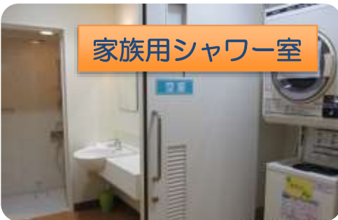
家族用シャワー室