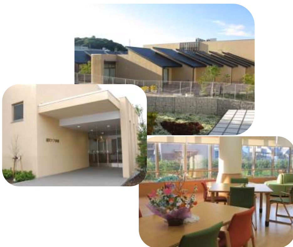
小牧市民病院 緩和ケアセンター